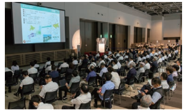
※上記写真は 2022 年 7 月に仙台で開催した「第3回 地域 xTech 東北」の様子。